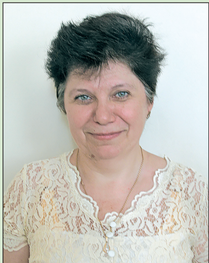
Точка зрения главного редактора