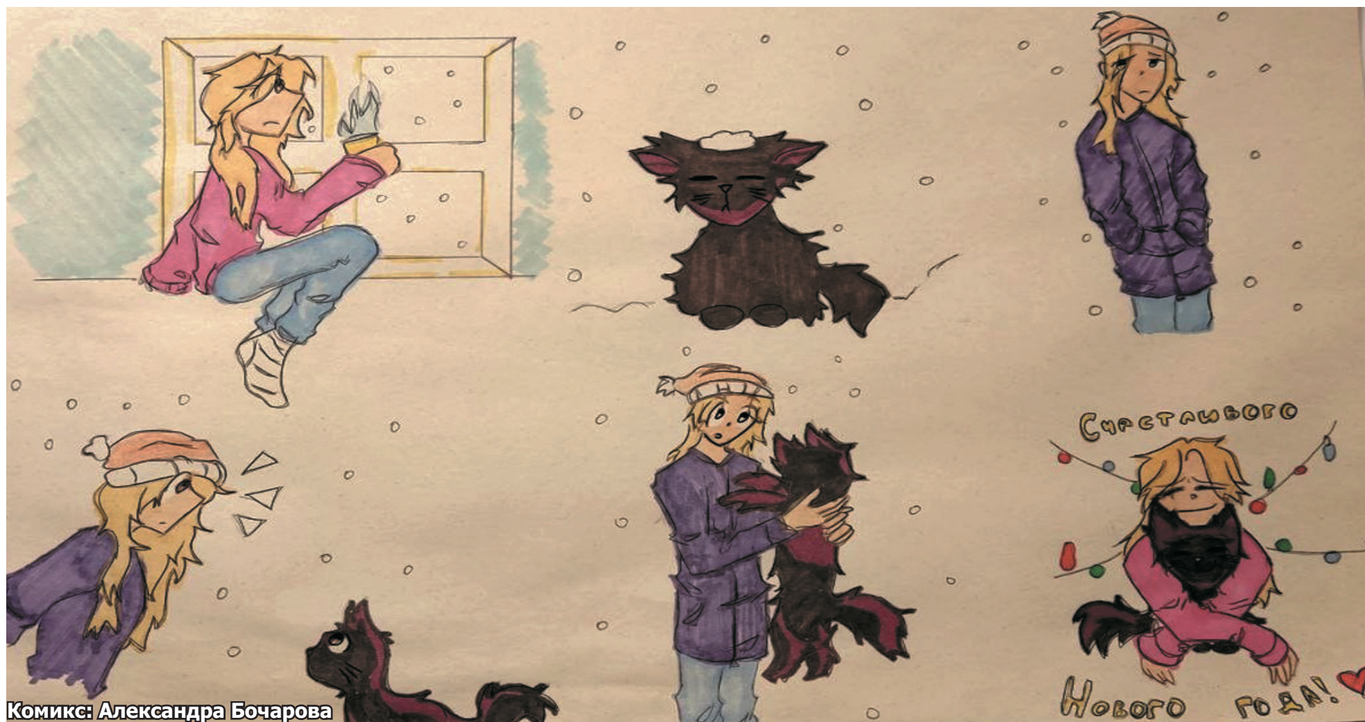
Комикс: Александра Бочарова